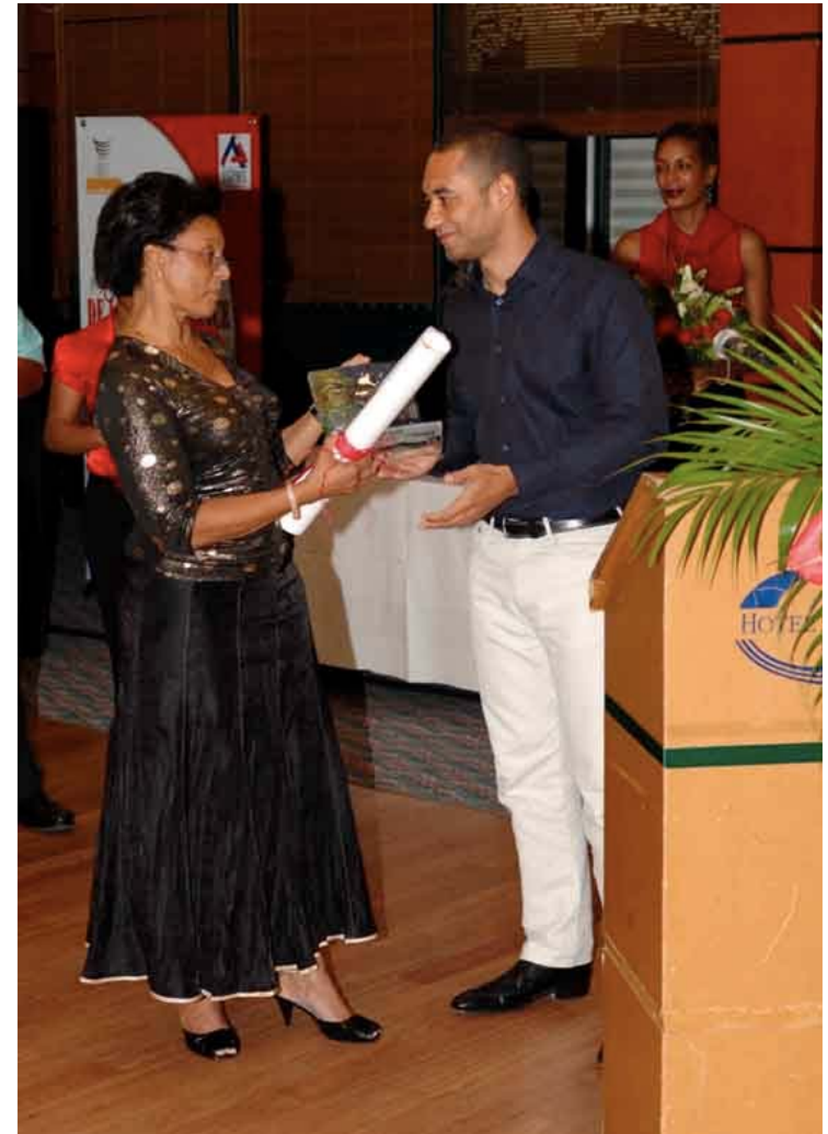
Remise du Prix Parcours Exemplarité