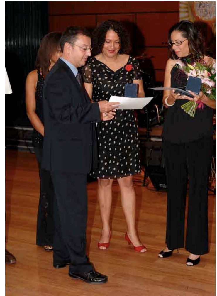
Remise du prix de l'engagement 2