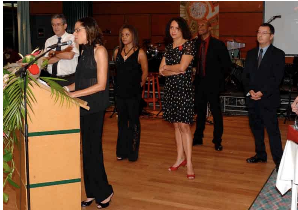
Les juges consulaires