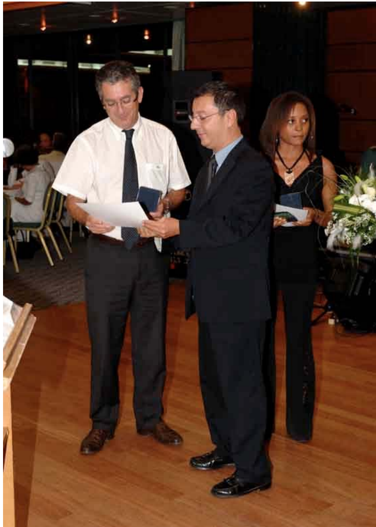
Remise du prix de l'engagement 3